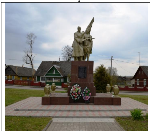
8. Фотоснимок захоронения